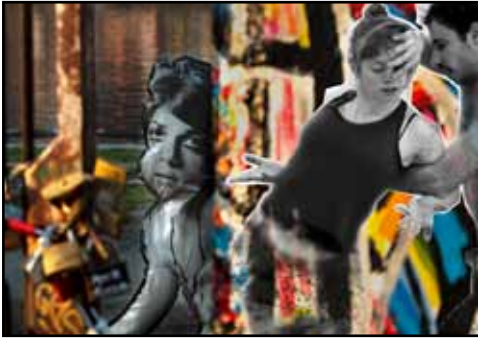
Serie BERLIN 61-89 Titel: DIE DRITTE

Grösse: 70x50 Technik: Fotografie, Digital composing, Edel Metall (Silber)