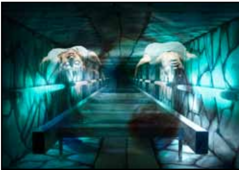
Serie WoMan Titel: SIRENE

Grösse: 70x50 Technik: Fotografie, Digital composing, Edel Metall (Silber)