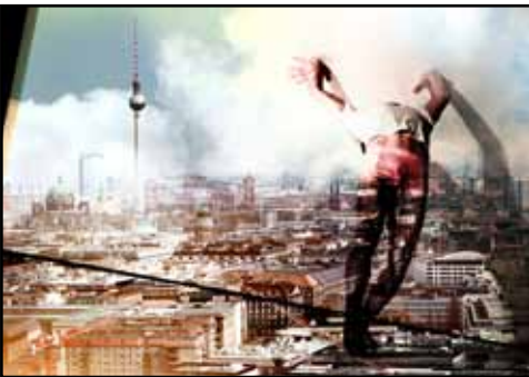
Serie BERLIN 61-89 Titel: ANDREA

Grösse: 100x70 Technik: Fotografie, Digital composing, Edel Metall (Gold 24 K)