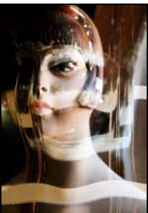
Serie WoMan Titel: BAMBOLINA

Grösse: 100x70 Technik: Fotografie, Digital composing, Edel Metall (Gold 24 K)