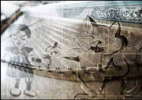
Serie BaRock Titel: DUETT FÜR CEMBALO

Grösse: 100x70 Technik: Fotografie, Digital composing, Edel Metall (Silber)